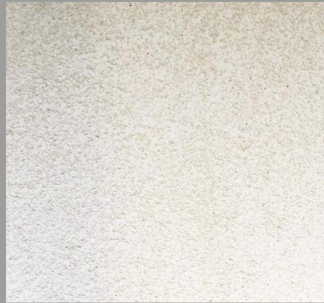
Col. 048— 1Toner code 50481