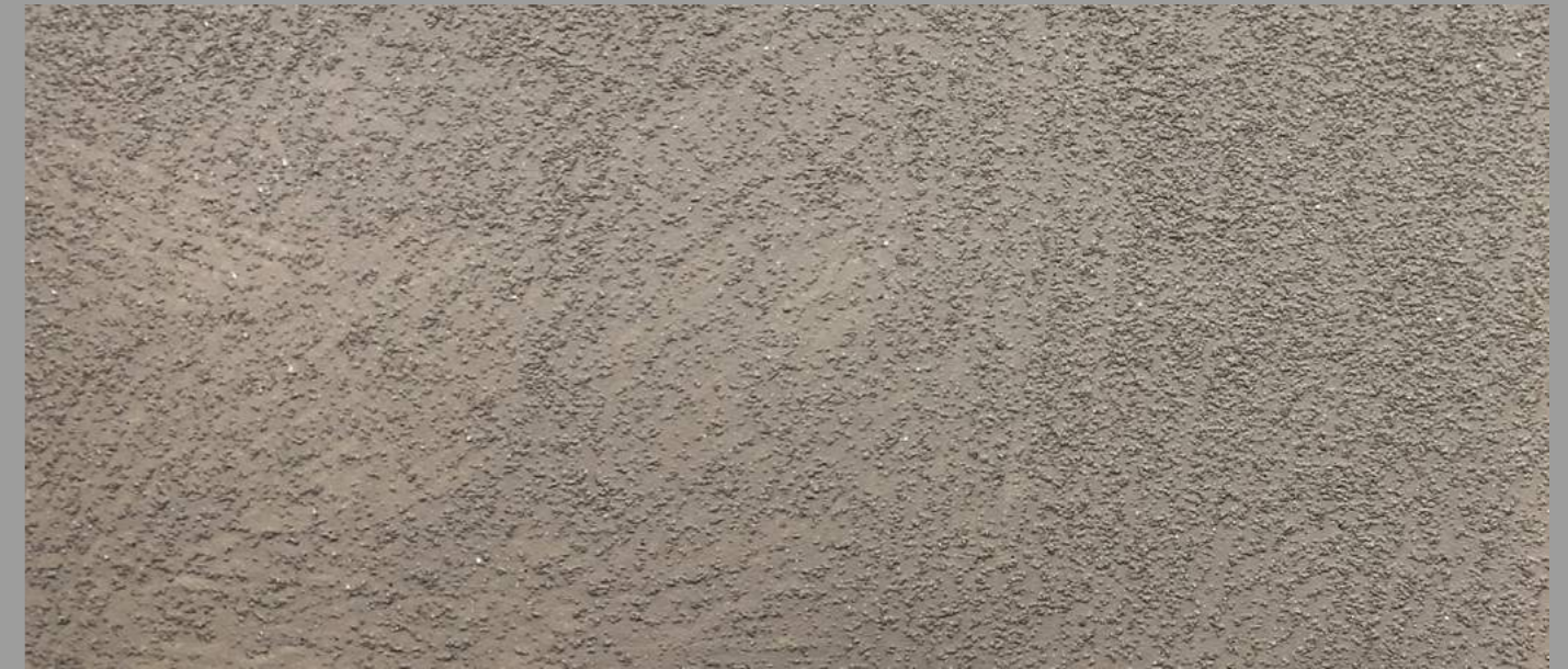
Col. 053 — 1Toner + Materia Diamonds code 50531MD