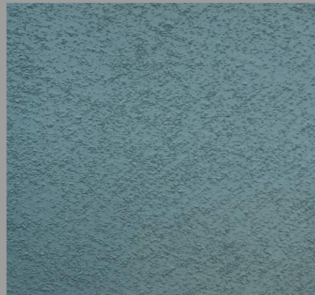
Col. BOLD 22 [008 - 2 toner + 014 - 4 toner] code 5B0LD22