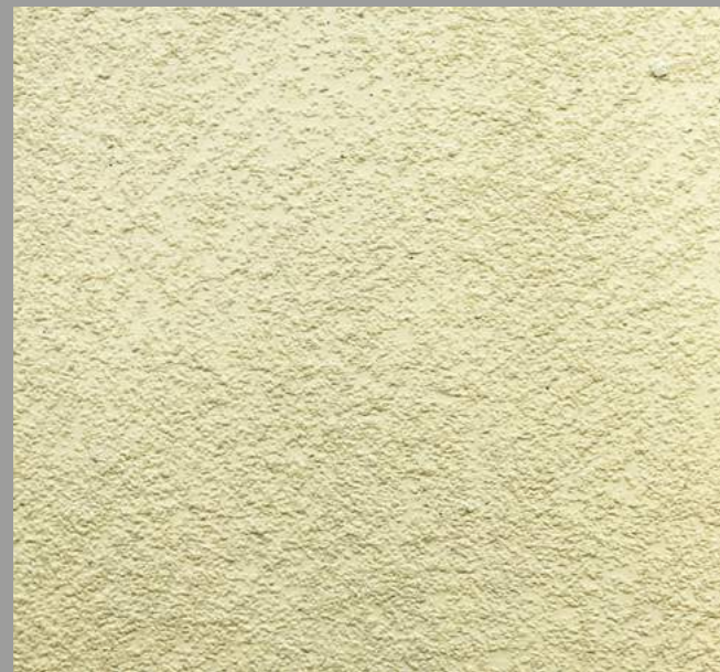
Col. 043 — 1Toner code 50431