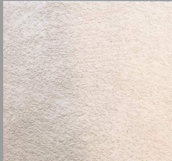
Col. 044 — 1Toner code 50441