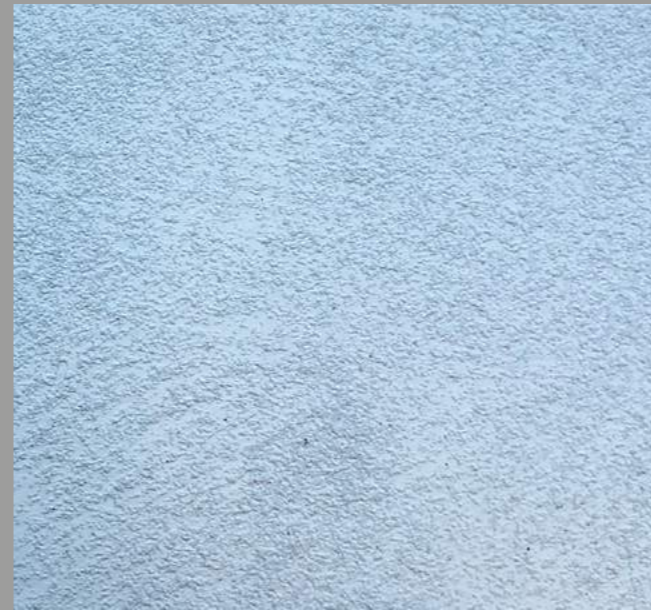
Col. 039 — 1Toner code 50391