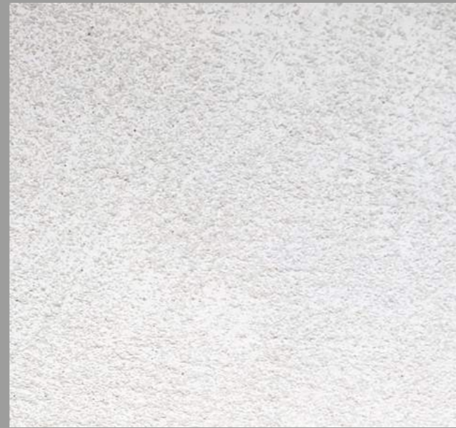
Col. 042— 1Toner code 50421