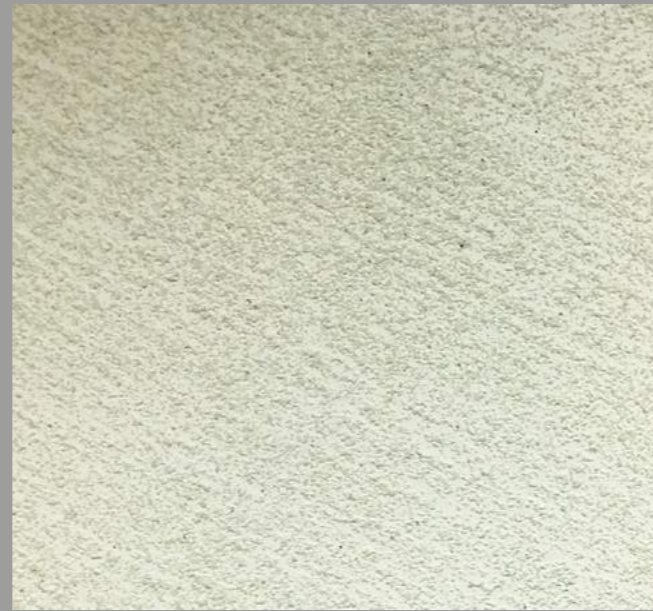
Col.041— 1Toner code 50411