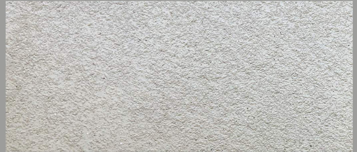
Col. 038— 1Toner + Materia Diamonds code 50381MD