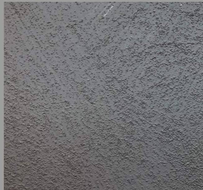
Col. BOLD 23 [008 - 2 toner + 014 - 1 toner] code 5B0LD23