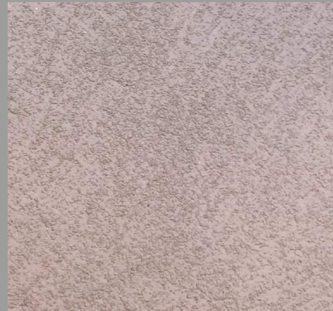
Col. 052— 1Toner code 50521